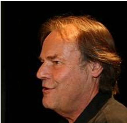
Peter Schneider, Schriftsteller *1940