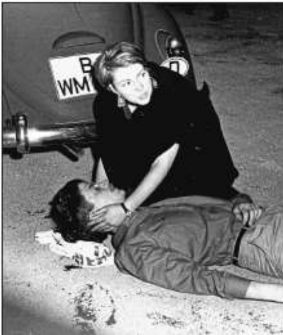
Uwe Timm: Ein Bild, das sich im Bewusstsein verankert