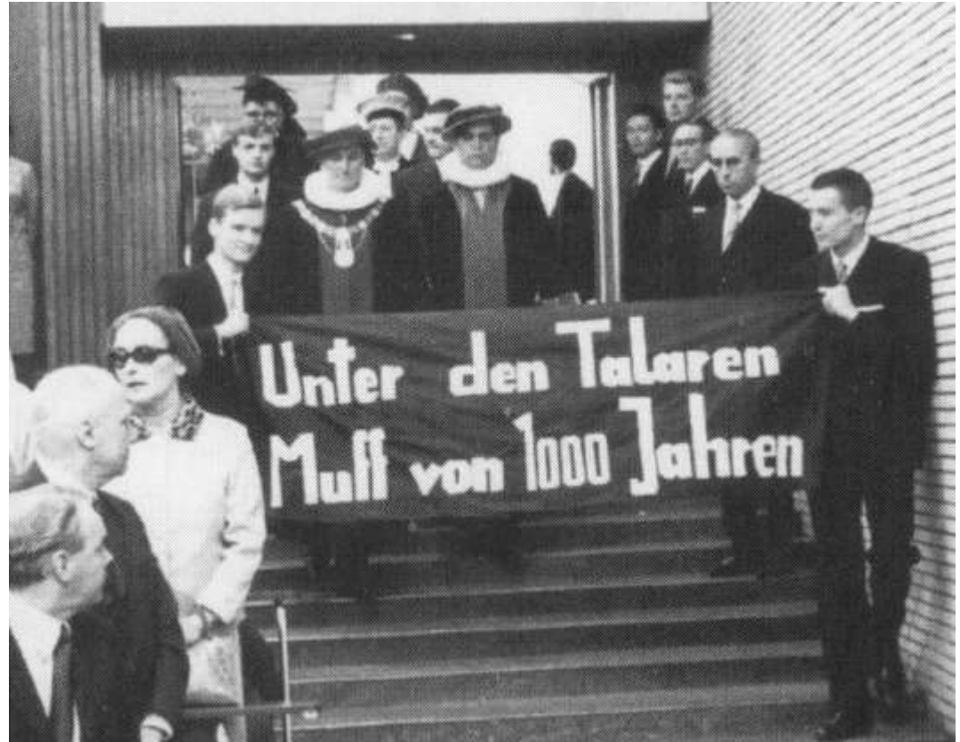
Immatrikulationsfeier Uni Hamburg 9.11.1967